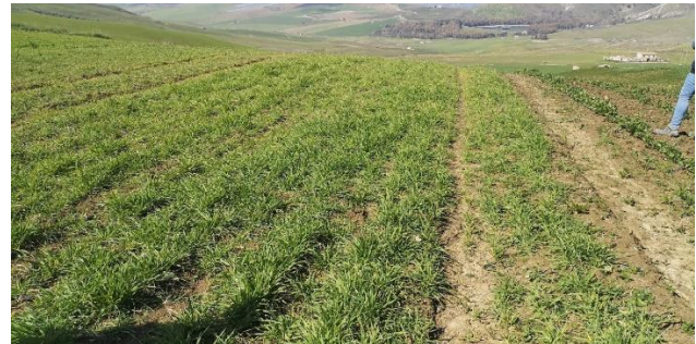
Azienda Scalora, Piana degli Albanesi (PA) – Prova di avvicendamento: orzo