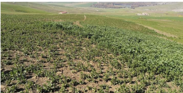
Azienda Ferrantello (Piana degli Albanesi, PA)– Prova di avvicendamento: favino