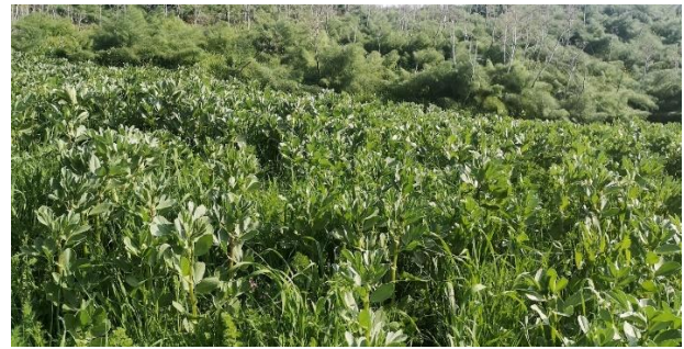
Azienda Vassallo (Campobello di Licata, AG) – Prova di avvicendamento: favino