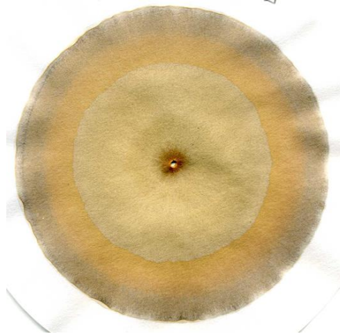
Esempio di cromatogramma

Durante i mesi invernali è stato monitorato il campo oggetto della prova agronomica, riportando, se presenti, problematiche dovute a piante infestati e/o a danni provocati da animali selvatici.